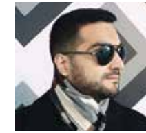
بِقلم: علي ماضي المستشار المالي بشركة ادورد جونز للاستثمار

"كن متردداً عندما يجازف الآخرون، وكن مجازفاً عندما يتردد الآخرون."