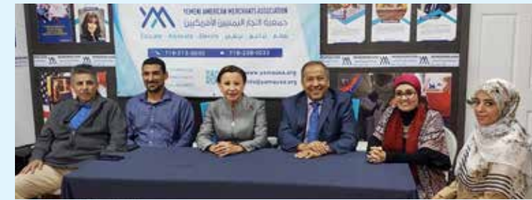
عضوة الكونجرس Nydia Velazquez التي ساعدت عائلة العامري الفائزة بفيزا اللوتري