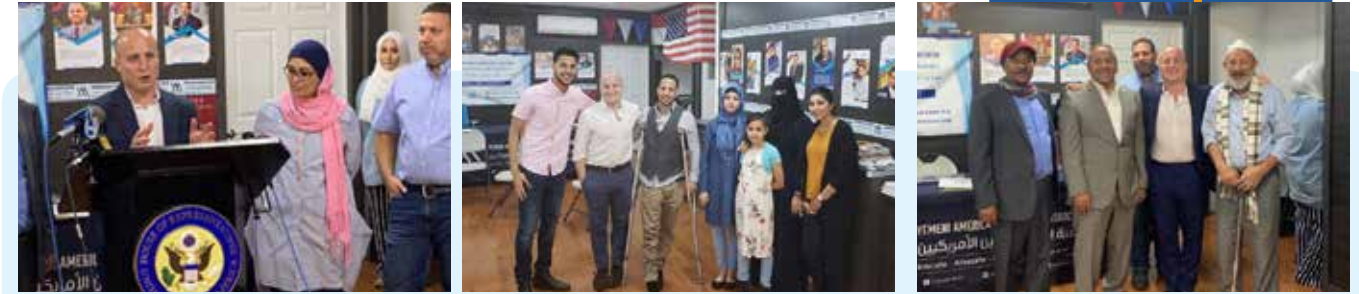
عضو الكونجرس ماكس روز مع ثلاث عائلات يمنية أمريكية ( العاهري _ المليكي ) ساعدهم في الحصول علي فيزا الهجرة

يعتبر العمل من اجل لم شمل العائلات اليمنية الامريكية هو جوهر عمل جمعية التجار و السبب الرئيسي وراء نشأتها. فمئذ مظاهرة البوديجا سترايك التاريخية والتي أيقظت المارد في المجتمع اليمني الأمريكي، الذي نهض للدفاع عن حقوقه بعد قرار حظر السفر.